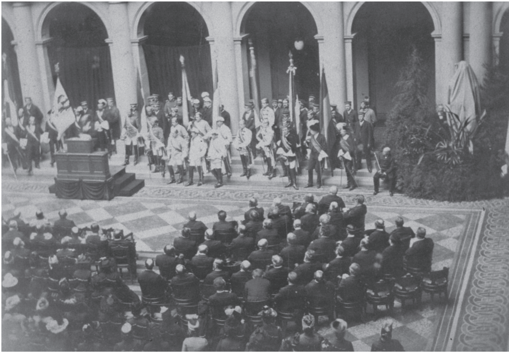
Keizer Wilhelm I brengt een bezoek aan de Universiteit van Straatsburg, 1886.