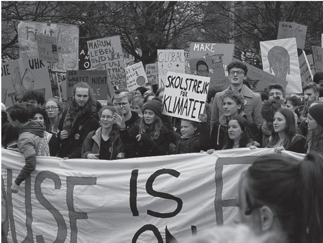
Het kritische zelf in verhouding tot de wijdere wereld. Greta Thunberg samen met andere scholieren bij een van de FridaysForFuture-demonstraties. Berlijn, 29 maart 2019.