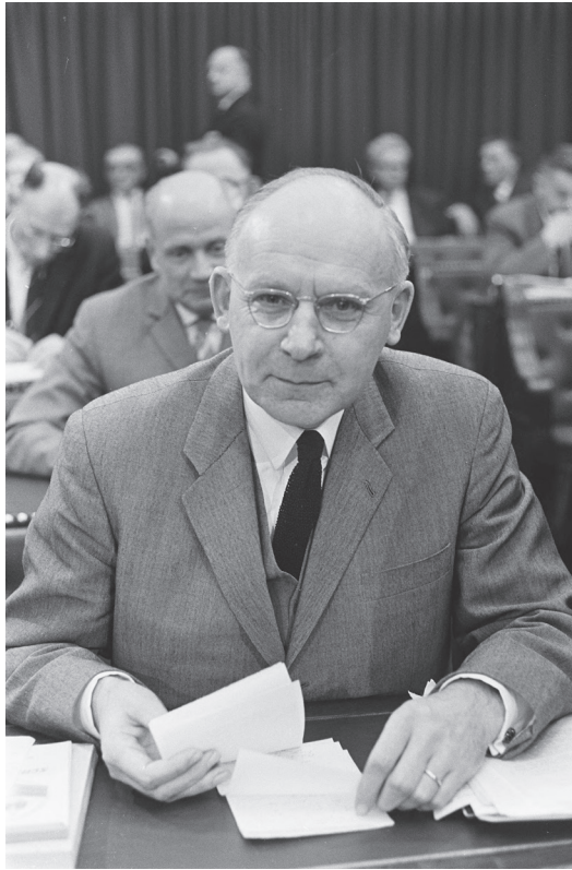
Anne Vondeling (PvdA) in de Tweede Kamer.

was gebleven bij de commissievergaderingen. In de plenaire vergadering uitte zijn partij echter kritiek op het verslag, terwijl zij geen amendementen wilde indienen uit angst voor het verwijt van 'partijdigheid'. Daartegenover stelden leden van andere fracties dat de commissievergadering in dienst stond van de onafhankelijke uitwisseling van argumenten ten aanzien van verzoeken in voorbereiding op een evenwichtig oordeel aan de controlerende Kamer ten behoeve van burgers. Hier stonden de twee perspectieven tegenover elkaar. Enerzijds werd het belang benadrukt van procedures en regels voor de onafhankelijkheid van de volksvertegenwoordiging en voor de rechtsbescherming van burgers, anderzijds bestond het idee dat die regels en processen de directe vertegenwoordiging