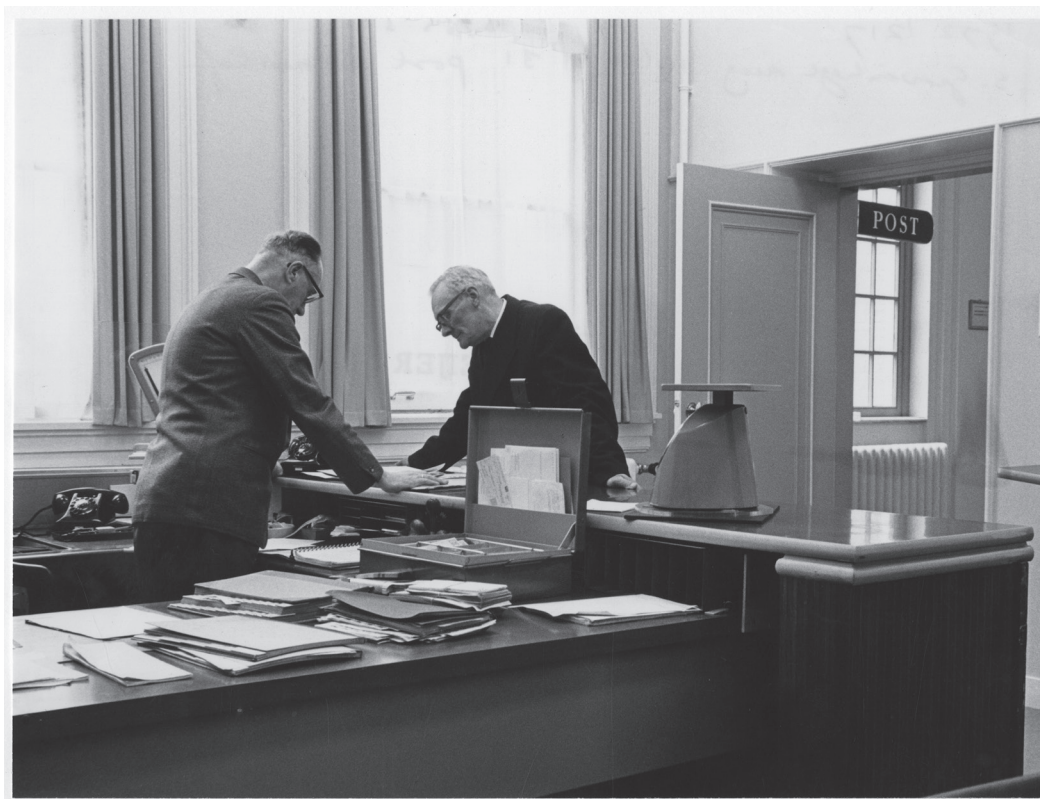
Het postkantoor van het parlement in 1964 waar onder meer verzoekschriften binnen kwamen.

Haags Gemeentearchief, Den Haag, identificatienummer 0.11028, fotograaf: Jacques Meijer, augustus 1964