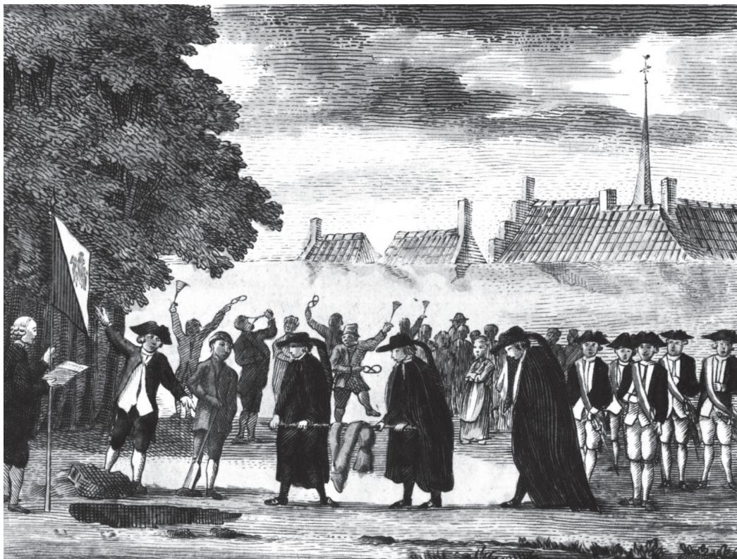
[An.] Spotprent 'De uitvaart van de orange echarpe'. Het vrijkorps te Utrecht begraaft op 14 september 1784 plechtig de oranje sjerpen.

Collectie Het Utrechts Archief, catalogusnummer 39543