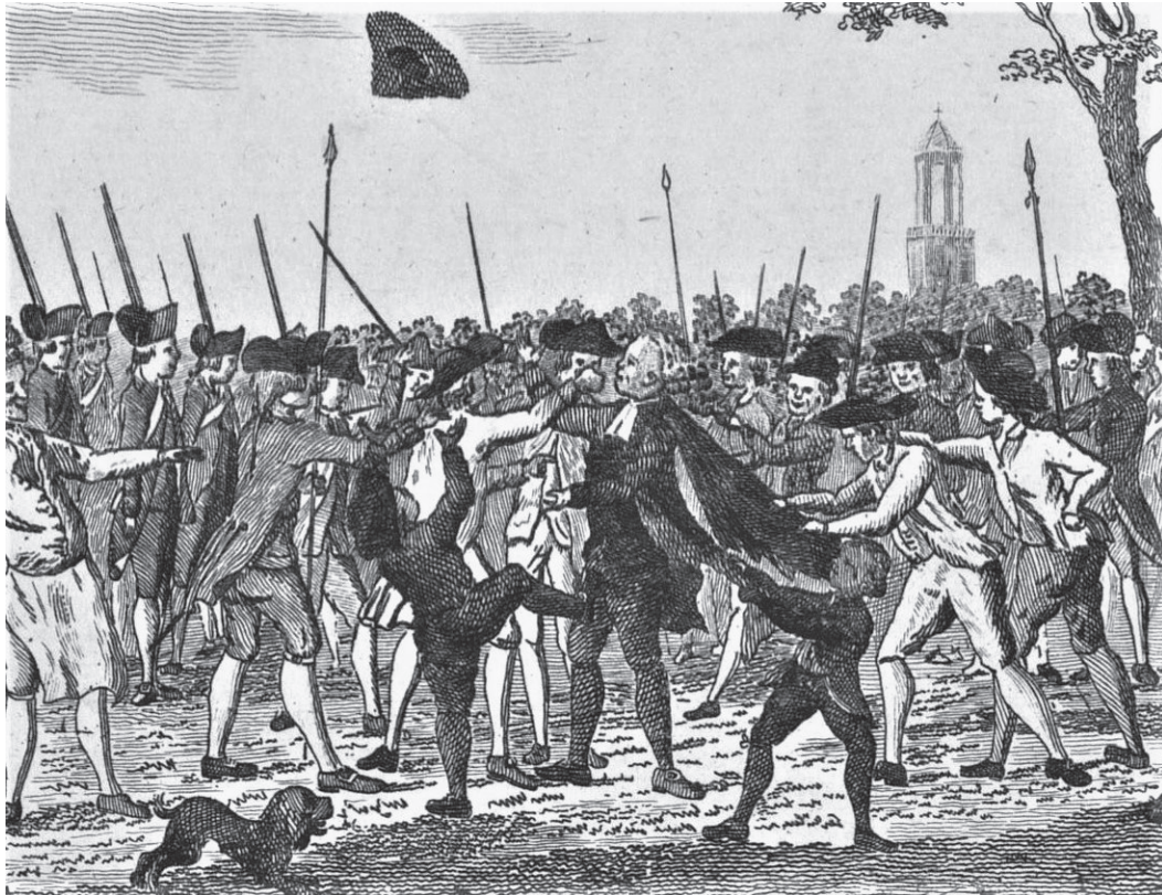
[An.] Mishandeling van de prinsgezinde predikant Petrus Hofstede door exerceerende leden van de Utrechtse Vrijkorps in het Sterrenbos te Utrecht, 1 september 1783.