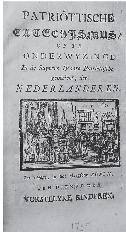
Titelblad Patriöttische Catechismus .

Stadsarchief Amsterdam, Collectie jhr. mr. Gijs C. Six 30741, Archief van Slingelandt 2.1-2.20